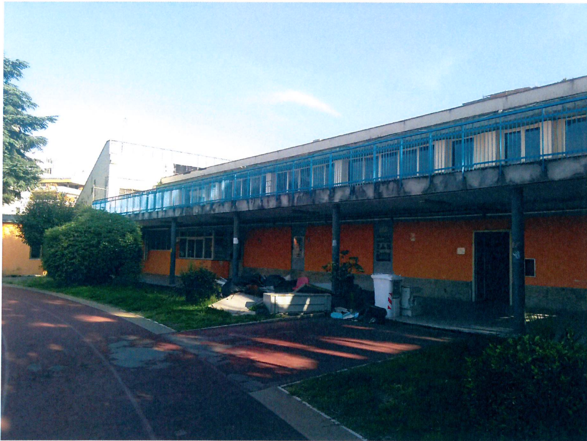
Ingresso Blocchi D1-D3